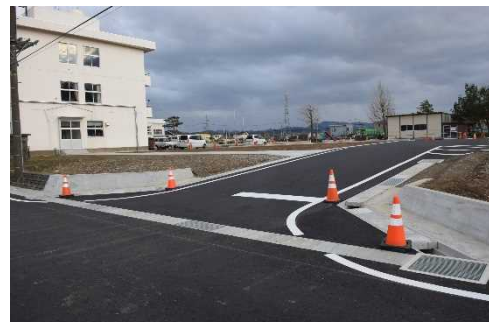
農道からの乗入口