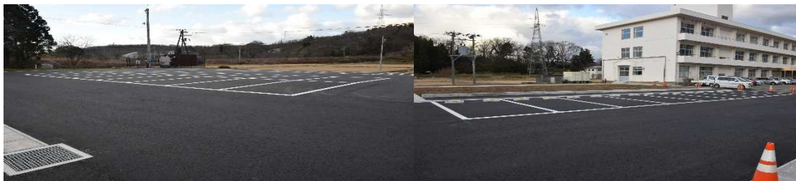
34台の車がゆったりと止められる駐車場

10月から始まった旧体育館跡地の整備工事がほぼ終了し、駐車場と農道の舗装、教材園が完成しました。今後、検査等が行われ、駐車場は来年2月から使用できる見込みです。