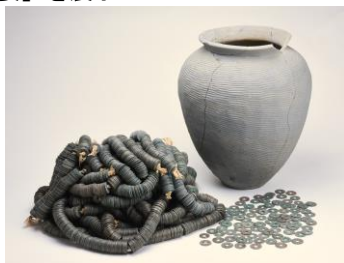
柏崎市東原町遺跡の珠洲焼と古銭