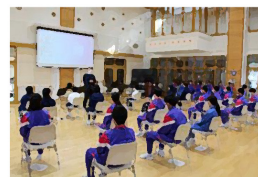
「素晴らしいオリエンテーションでした。」