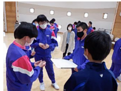
全校でレクリエーション