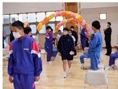
花道を通して新入生入場