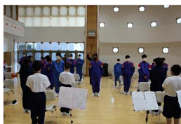
2,3年生から新入生へエール