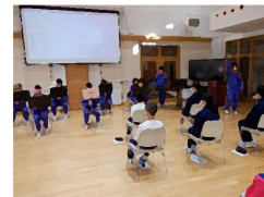
部活動紹介の様子