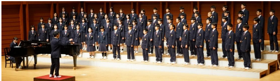
2学年 学年合唱 「あなたへ～旅立ちに寄せるメッセージ～」 2年1組「時を越えて」 2年2組「いのちの歌」