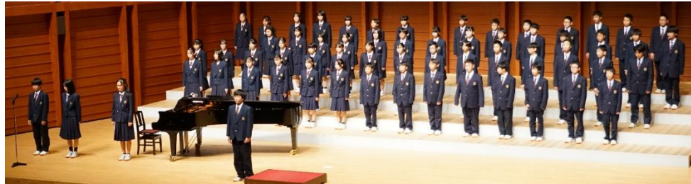
1学年 学年合唱「COSMOS」 1年1組「大切なもの」 1年2組「マイバラード」

近年まれに見る素晴らしい歌声、素晴らしい合唱。一中生のもつ限りないエネルギーが全面に感じられた1日となりました。会場まで足を運んでくださった保護者、地域の皆様、ありがとうございました。