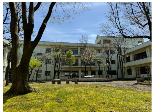
中庭から望む校舎