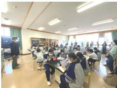
1年2組の理科の授業