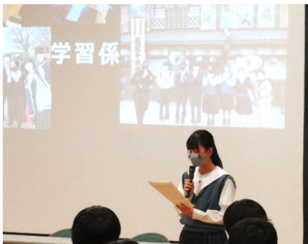
3年生の修学旅行成果発表会

まだまだ制約のある中でのPTA活動となりますが、二中は保護者、地域の皆様との触れ合いを大切にしていきたいと思います。今後ご理解、ご協力よろしくお願いいたします！