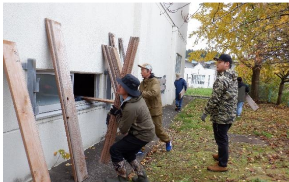
落とし板を取り付け、冬の準備ができました。