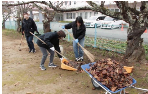
グラウンドもすっかりきれいになりました。

11月9日(日)に、PTA奉仕作業が実施され、51名の会員の方からご参加いただきました。当日は雨も降らず、順調に作業をすることができました。作業は、冬囲い、落とし板の取り付け、側溝清掃、落ち葉集め、の4班に分かれて行いました。