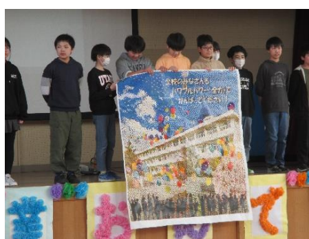
6年生からドット絵のプレゼント