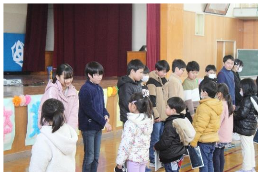
1年生からのプレゼント渡し

3月1日(金)は、「6年生に感謝する会」を行いました。5年生が12月から計画を立て、各学年が役割を分担して準備してきました。体育館いっぱいに感謝の気持ちがあふれる、あたたかい会となりました。