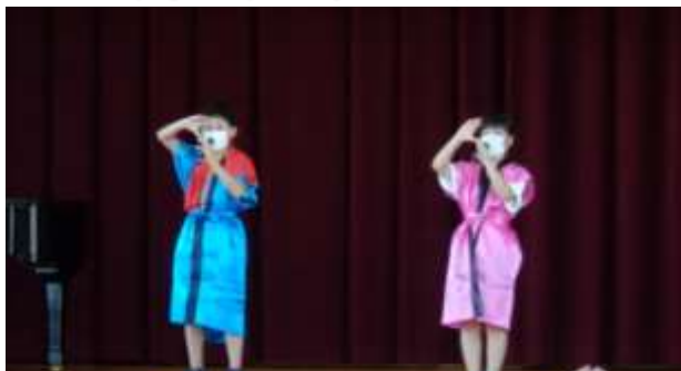
運営委員の名司会で会場は大興奮！