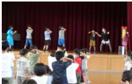
6年生はダンスで全校にアピールしました。

今年度の「君こそスターだ！七夕編」は出場希望者が昨年度よりも多かったため、7月6日（水）・7日（木）の2日間をかけて昼休みに実施しました。2日間で11組もの出演があり、内容もダンス、歌、都道府県クイズ、ピアノ演奏、空手、寸劇など、昨年以上にバラエティに富んでいました。そして、出演した子どもたちは、ステージ上で最高のパフォーマンスを披露していました。