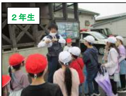
2年生 交番に行って、おまわりさんにいろいろな道具を見せていただきました。