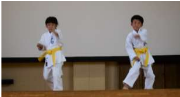
1年生の2人は空手を披露