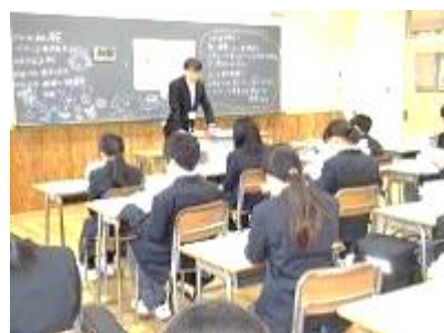
< 1 年 3 組 >