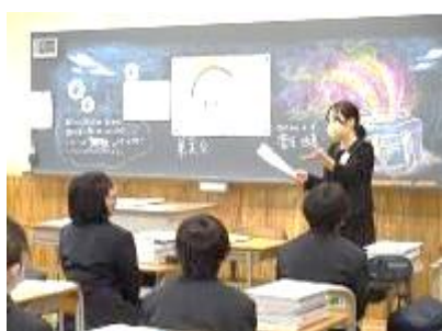
< 1 年 2 組 >