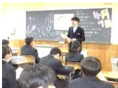
< 1 年 1 組 >