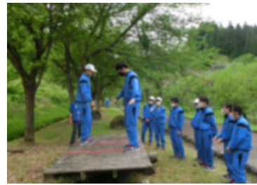
2年生：高柳への遠足