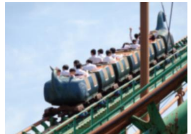
3年生：県内での修学旅行