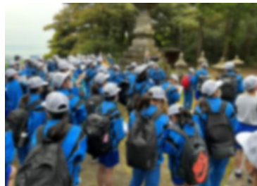
1年生：大泉寺からの遠足

各学年で行事を行いました。行事を通して経験したこと、学んだことを今後の学校生活につなげていきましょう。