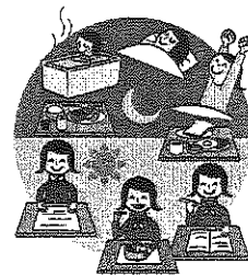
生活リズムを整えて