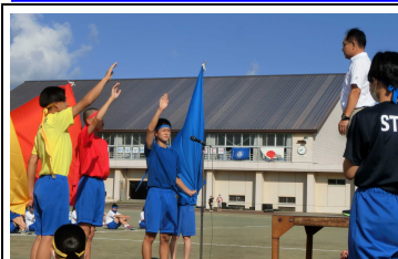
応援団長による選手宣誓

コロナ禍ではありますが、工夫をしながら学校行事や各学年の教育活動を実施しました。10月2日には秋晴れの下、体育祭を行いました。全県にわたる「特別警報」により日程や種目の変更や配慮事項が多くあり、生徒は競技運営や応援の準備が思うようにできず不安な所もあったと思います。しかし、そんな状況を微塵も感じさせない体育祭となりました。しかし、今回の体育祭成功の陰には、多くの人たちの見えない気遣いや支えがたくさんありました。そのことに気づき、素直に感謝できる生徒になってほしいと思います。そして、見えないところで活動してくれた生徒やご協力くださった保護者やご家族の皆様へ心から感謝申し上げます。