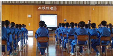
マナー講習会(2学年)