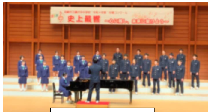
最優秀賞 3年1組「信じる」