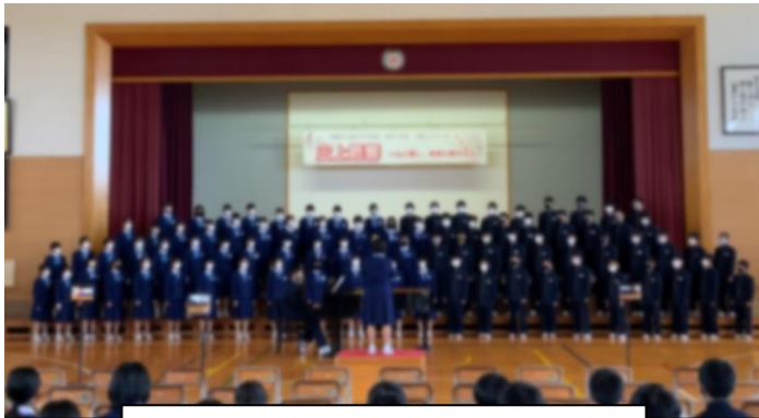
1 学年合唱「Let' s search for tomorrow」