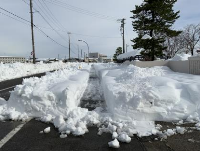
半田地区方面の通学路