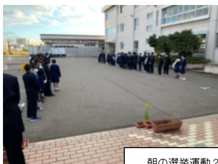
朝の選挙運動2日目 立候補者・責任者・応援者が元気なあいさつをしています