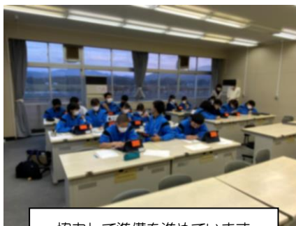
協力して準備を進めています