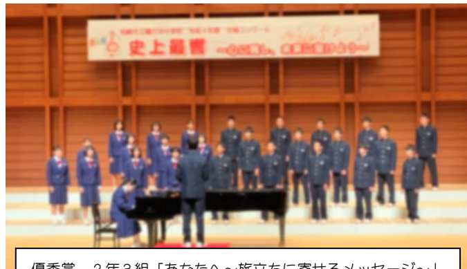
優秀賞 2年3組「あなたへ～旅立ちに寄せるメッセージ～」