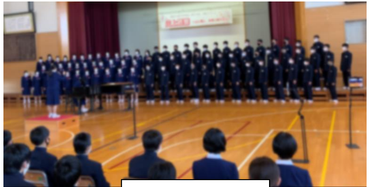
2 学年合唱「地球の鼓動」