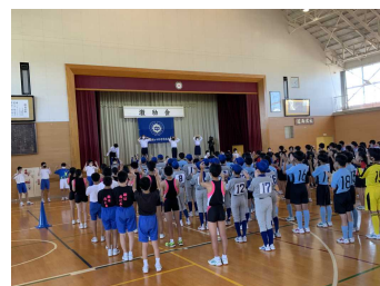
【応援リーダーによる全校応援】

勝った者は、全力で対戦してくれた相手選手に敬意を表し、感謝し、謙虚な姿勢でその後も地道に練習を重ねることが大切です。負けた者は、決して投げやりになったり、言い訳したりするのではなく、素直に相手の勝利を祝福してください。そして、その悔しさをバネに次のステージで挽回するための準備を着々と始めてください。