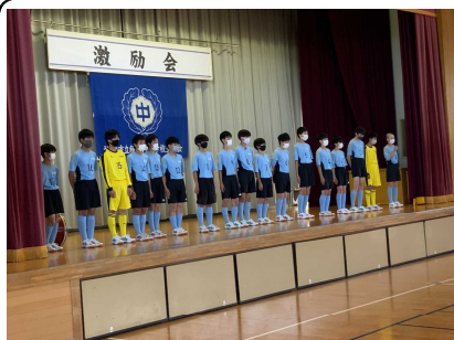
【一人一人の決意表明】

6月9日(木)の上越地区大会激励会は、ステージ上で一人一人が大会に向けての決意を述べるという従来に近い形で実施しました。コロナ禍のため、従来の形を知らない生徒でしたが、応援委員、部長を中心に練習を重ね臨みました。当日は、心地よい緊張感漂う体育館で激励会が行われ、頑張る生徒を互いに応援し合い、じっくり話を聴くという心温まる光景も随所に見られました。大会を迎えるにあたり以下のことを生徒に伝えました。