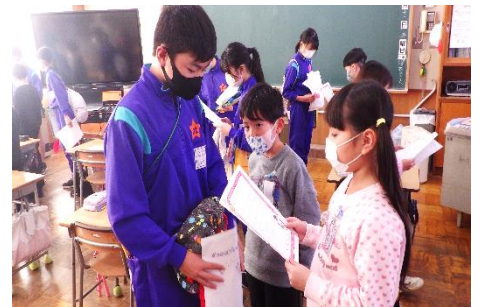
～あったかカードの交換～