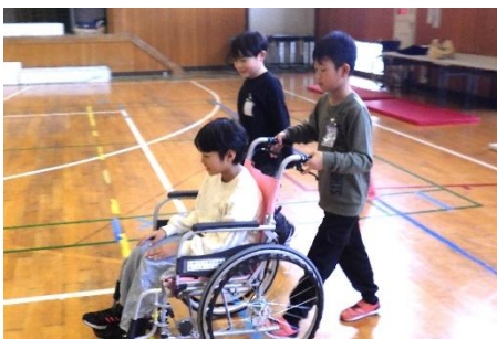
～総合的な学習の時間・車椅子体験～