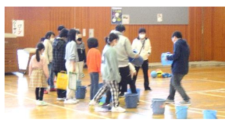
健康委員会：バケツリレー