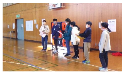
運営委員会：企画・運営・進行