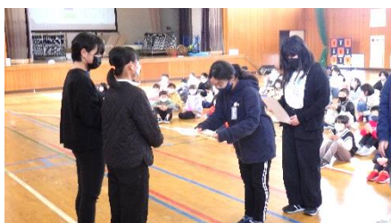
生活委員会：結果集計・表彰