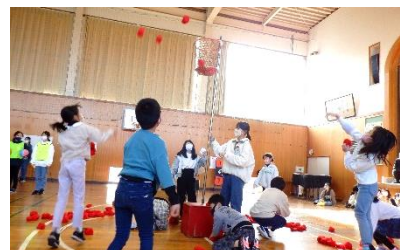
環境委員会：玉入れ