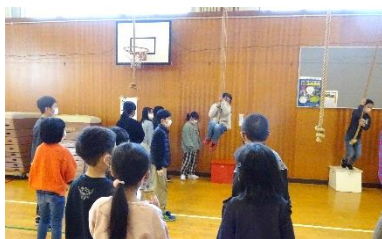
給食委員会：ターザンロープ