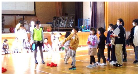
図書委員会：ストラックアウト