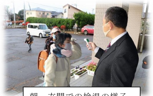
朝、玄関での検温の様子

残念なことに、11月中旬頃から、新型コロナウイルス流行第3波が起こり、11月24日以降、様々な教育活動に影響が出ています。柏崎市教育委員会からは次のような指示が出ています。