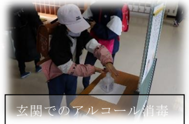
玄関でのアルコール消毒

残念ながら、多くの教育活動に影響が出ています。しかし、子どもたちは元気に登校してきており、国語・算数を中心とする主要教科は、いよいよ学年のまとめに差し掛かり、1月末にはNRT学力検査が実施されます。様々な活動が縮小されるのは残念ですが、視点を変えれば、基礎学力を高める絶好の機会と捉えることができます。1・2月は、学力向上を学校と家庭とで共通の目標とし、取り組んでいきましょう。