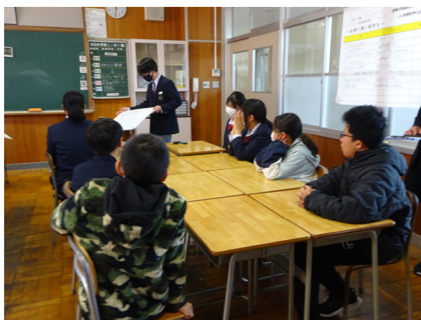
グループで話し合いをしました