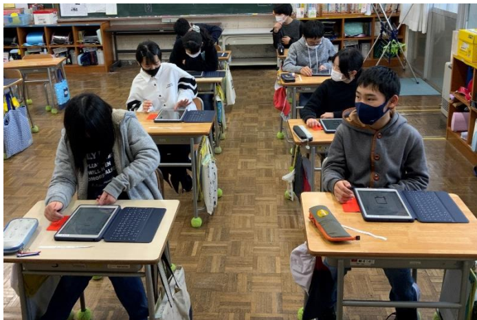
【5・6年生が授業でiPadを活用してる様子】

各ご家庭には、「柏崎市立小・中学校『学習用iPad活用のルール(学校・家庭学習編)』」をお配りしました。お読みいただいたうえで、趣旨をご理解いただき、ルールに則った活用について、ご協力をお願いいたします。