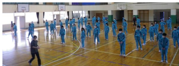
毎年恒例のダンスの授業もはじまりました。生徒たちは楽しそうに踊っています。

今年度も残すところ3ヶ月。3年生は卒業に向けて、1, 2年生は進級に向けての大切な時間となります。これまでの活動を振り返り、自分の、そして集団の成長を確かめたり、やり残した点を見直したりしながら、春に向けて準備を進めてほしいと思います。