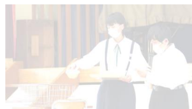
実演を交えての説明

10/16～10/20、食事のマナー向上を目指してマナーアップ週間を実施しました。「食器を傷つけないよう丁寧な扱いを」、「いただきますなど、感謝の気持ちをこめてあいさつ」、「ひじをつかずに正しい姿勢で」など、当たり前の行動を再確認することができました。